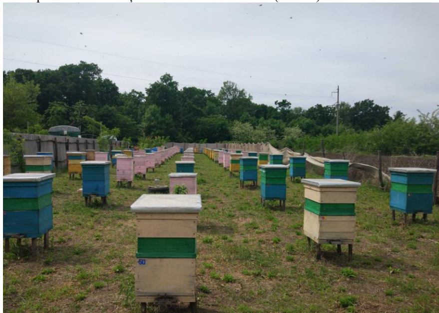
Figura 1. Stupina din s. Brătuleni Figure 1. The apiary from Brătuleni village

Lucrarea a fost realizată în cadrul proiectului nr. 20.80009.5007.17 al Agenției Naționale pentru Cercetare și Dezvoltare din Moldova (ANCD).