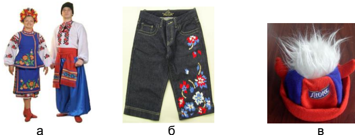
Рис. 1: Варианты одежды с элементами вышивки

совершенного образца при взвешенной стоимости изделия. Это дает возможность удовлетворить эстетические потребности, эксплуатационные требования потребителя, и, соответственно, спрос. Здесь также важными являются такие преимущества машинной вышивки - создания узоров большой площади без значительных временных и финансовых расходов. Такая постановка значительно расширила область использования вышивки. Вышивка как узор, изображение, рисунок - может быть инновационным эффективным носителем современной информации, не теряя свою высокую художественную выразительность. На рис. 1 поданы некоторые варианты объектов дизайна одежды с элементами вышивки.