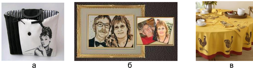
Рис. 2: Варианы объектов дизайна с элементами вышивки

На рис. 2 представлены некоторые варианты объектов дизайна вещей с элементами вышивки.