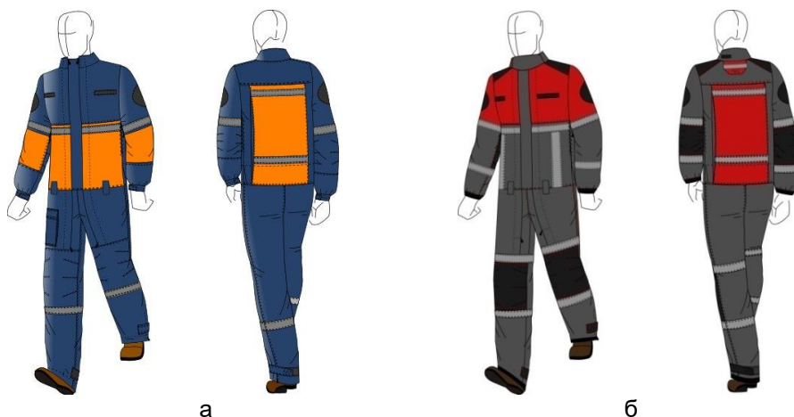
Рисунок 2: Художественно-проектное решение комбинезона для ликвидации последствий аварийной ситуации (а) и локализации пожаров (б)

При условии изготовления защитной одежды промышленным способом на условно-типовую фигуру важной является возможность адаптации одежды к морфологическим особенностям работников. Поэтому в защитном комбинезоне спасателя предусмотрены несколько способов регулирования ширины и