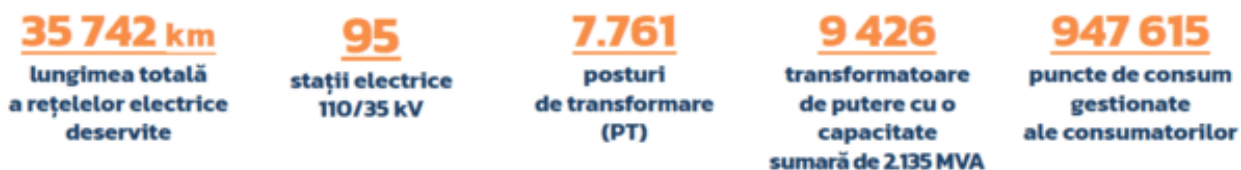
Figura 1. Cifre cheie ale rețelei ÎCS „Premier Energy Distribution”, SA

De-a lungul celor aproape 25 de ani de activitate în Republica Moldova întreprinderile private de distribuție și furnizare a energiei electrice, au beneficiat de experiențe inedite și implementează cele mai bune practici și standarde europene de gestiune a afacerilor.