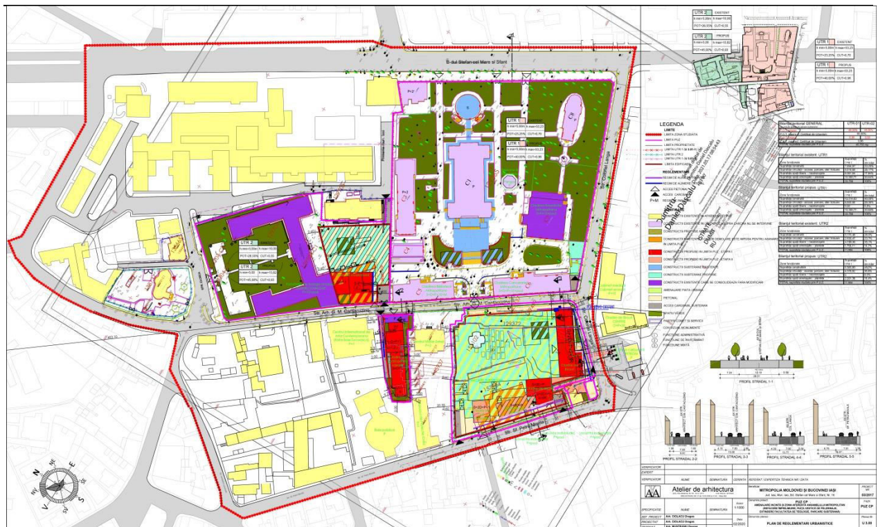
Figura 1. Plansa reglementari urbanistice