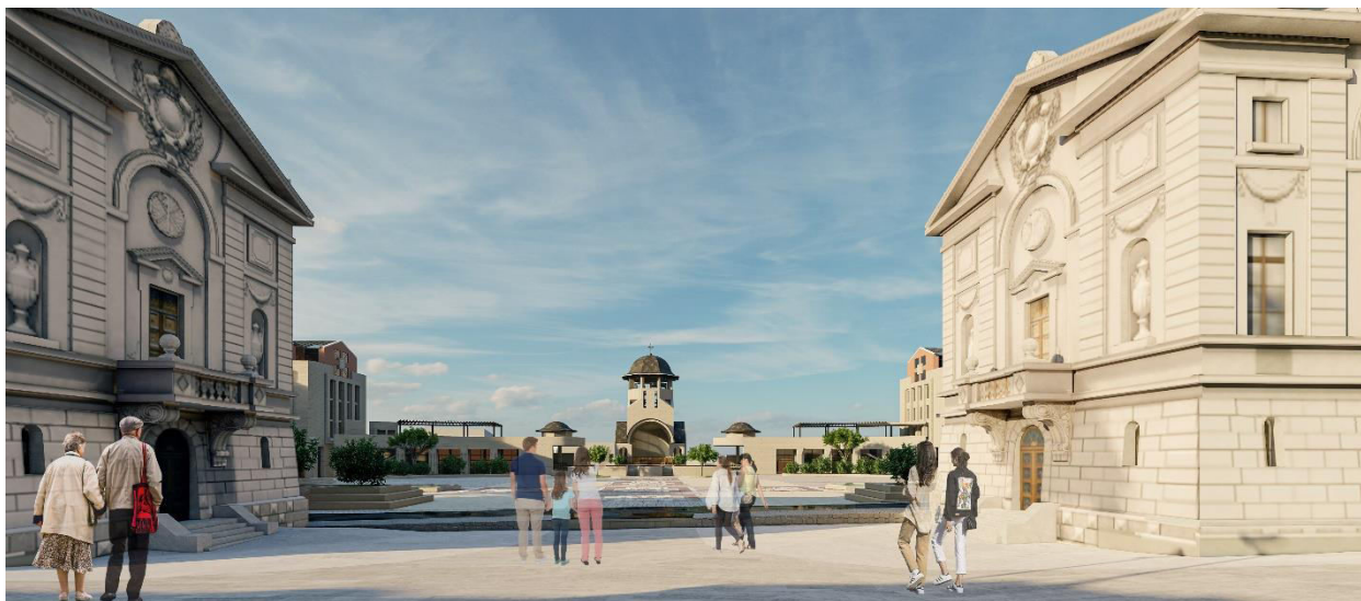
Figura 5. Perspectiva de ansamblu- Situație propusă

Axa majoră vest-est în parcurgere descendentă definită de catedrala Mitropolitană și cele două clădiri proiectate de G.M. Cantacuzino este menținută în spațiul pieței prin simetria după care sunt dispuse clădirile și se închide prin noua capelă – clopotniță care articulează ansamblul cu vecinătățile din lunca Bahluiului. Pe latura sudică și nordică viața este definită de două clădiri, birouri administrative și hotel cu același gabarit ca al clădirilor așezate mai sus – cancelaria și biblioteca ce vor delimita piața spre răsărit. Pe latura vestică de o parte și alta a clopotniței sunt două clădiri identice cu funcțiune comercială având un regim de înălțime mic ce articulează cota pieței cu strada Petru Movilă, cu 8 metri mai jos. Aceste două clădiri se leagă de latura sudică și nordică cu două turnuri de înălțime medie cu funcțiune de birouri. Sub platoul pieței se prevăd trei nivele de parcare publice cu o capacitate de 400 de locuri.