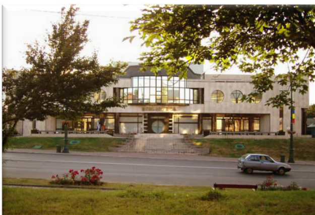
Fig. 4. Noua clădire a Bibliotecii Municipale „Radu Rosetti”- 2001.

Năzuința bibliotecarilor oneșteni devine realitate în 2001, când Biblioteca se mută în noul său sediu, aflat, poate nu întâmplător, pe terenul deținut, cândva, de nepotul lui Radu Rosetti, avocatul Rene Bogdan.