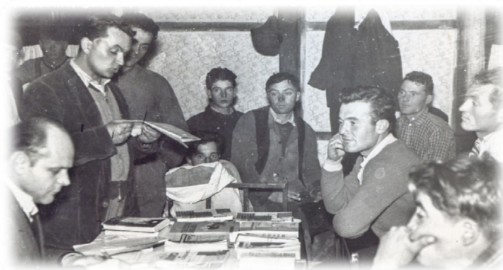
Fig. 2. Lectură în grup la Șantierul 3 – Oraș (1963).

Cele două decenii care au urmat au adus anularea în totalitate a fostei localități și construcția din temelii a noului oraș. Perioada în care s-a ridicat orașul a însemnat un efort susținut al tuturor echipelor de constructori, cazați mai întâi în colonii de muncă. Chiar în acele condiții, aspectele culturale ale vieții nu au fost lăsate deoparte. Săptămânalul „Oneștiul nou” reflectă destul de des, pe lângă tot felul de activități – teatru popular, concursuri pe diverse teme, formații artistice, etc – progresele înregistrate în munca bibliotecarilor. Apar în aceste pagini, pe lângă referiri la biblioteca orașenească, și știri despre biblioteca Clubului „Constructorul” și despre mici biblioteci de cartier.