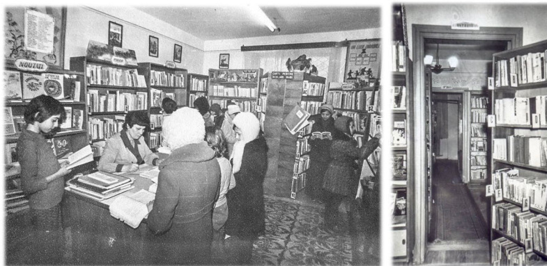
Fig. 3. Secția de împrumut copii și depozitul secției adulți – 1973.

Perioada extinderii orașului și a construcției zonei „Mărășești”, ca și numărul mare de instituții școlare din acest areal, au impus deschiderea, în 1979, a primei filiale a Bibliotecii Municipale. Intitulată „Cosânzeana”, ca un remember al începuturilor, ea a ocupat, mai întâi, un mic spațiu în uscătoria unui bloc. Mai târziu, pe măsură ce solicitările au crescut, sediul filialei a fost mutat în spații din ce în ce mai mari, mai întâi într-o garsonieră de pe Bd. Oituz, nr. 47, apoi într-o clădire de birouri, pentru ca azi să ocupe întreg parterul unei școli.