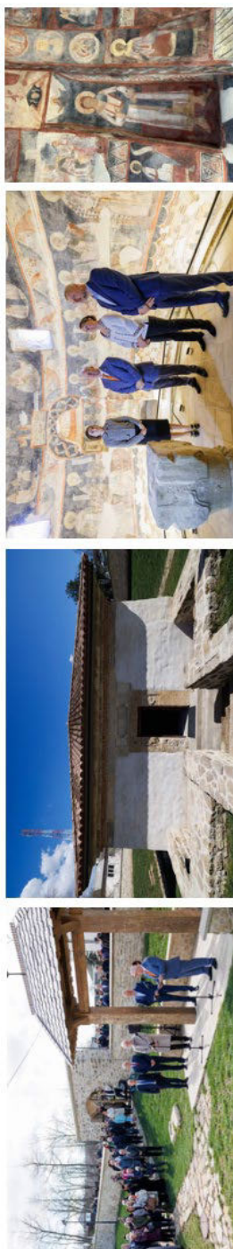
Redeschiderea bisericii „Adormirea Maicii Domnului” din Căușeni restaurată cu sprijinul financiar al Ambasadei SUA: 30.03.2024.