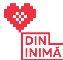
Figura 1. Logo-ul platformei DININIMĂ [1]

Producerea materialelor textile necesită un consum mare de apă, se mai adaugă și terenurile de creștere a bumbacului și altor fibre. Se estimează că se utilizează la nivel global 79 de miliarde de metri cubi de apă. 20 % din poluarea globală a apei curate deține industria textilă, din cauza