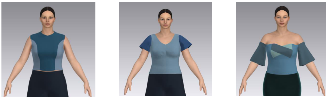
Figura 3. Exemple al modelelor realizate pentru femei cu aplicarea principiilor modei sustenabile, cu ajutorul CLO 3D

Industria modei este mereu în schimbare, dar produsele din denim mereu vor fi în trend și favorabile oamenilor. Denim-ul este un material care îl putem considera ecologic pentru durabilitatea lui și mereu în trend, dar îl putem clasa fiind ne ecologic, datorită procesului de producție, care se bazează pe coloranți chimici, creșterea bumbacului utilizând apă multă și pesticide. De aceea din produsele din denim vechi, se pot crea produse noi cum ar fi, jachetă combinată cu piele, cu materiale pentru costum, corsete, maiou cu denim, etc.