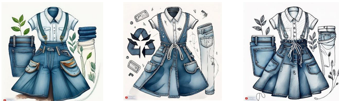
Figura 4. Schițe ale modelelor realizate pentru femei cu aplicarea principiilor modei sustenabile