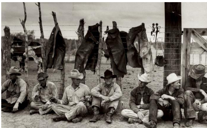
Figura 2. Primii purtători de produse din denim, lucrători [5]