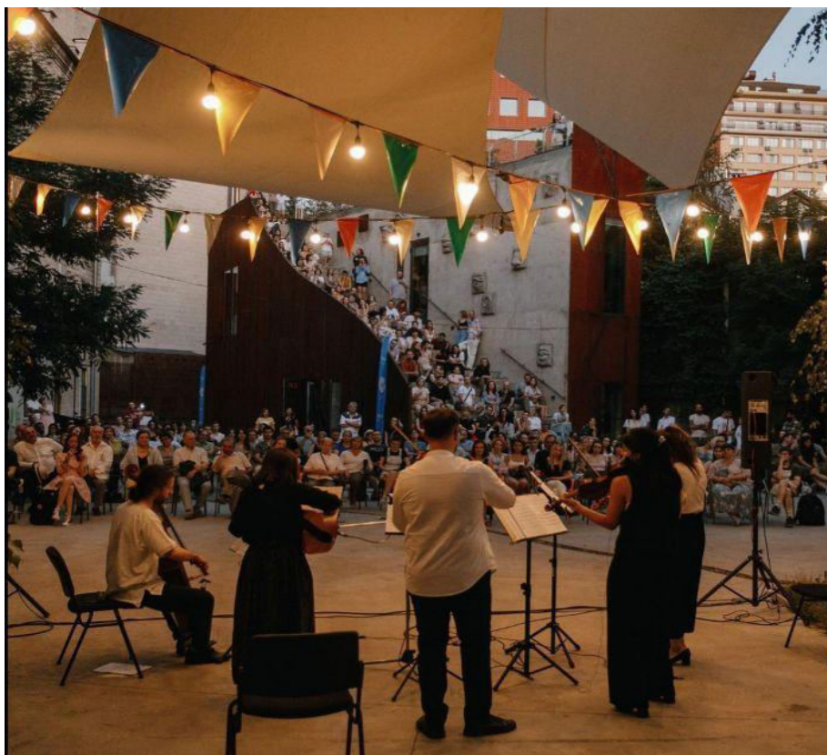
Figura 3. Concertul de muzică barocă, ARTCOR [8]