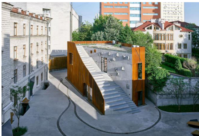
Figura 1. Centrul ARTCOR [1]

Soluția volumetrico-spațială a clădirii a fost determinată de configurația sitului, a clădirilor învecinate și de prezența unui monument de arhitectură de la sfârșitul secolului al XIX-lea - moșia familiei Kazimir-Keshko.