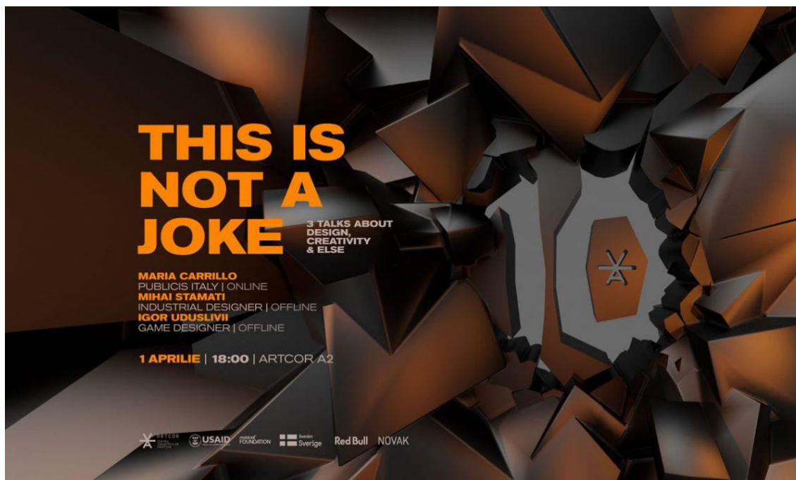
Figura 2. Evenimentul cultural cu genericul „Design Fundamentals” [5]

Artcor nu este doar un complex arhitectural, ci şi un centru cultural. Aici au loc expoziţii de artă, evenimente culturale şi expoziţii de fotografie [5]. După analiză amplă a proiectelor s-au clasificat sfere importate care sunt dezvoltate în cadrul Artcor, câteva din ele: film ( festivalul “ Classfest ”), muzica (concertul “ Cosmos în Buzunar ”), game development (cursul “ Modeling for Games ”), graphic design ( “Design Fundamentals” ) (fig. 2).