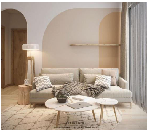
Figura 3. Living în culori monocromatice luminoase