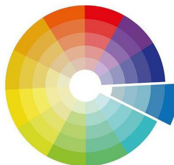
Figura 2. Schema de culori acromatice

În practică foarte mulți confundă culorile monocromatice cu cele acromatice, ele fiind considerate aceleași însă există o diferență majoră între ele. Diferența fundamentală, care distinge cele două tipuri de culori este că, culoarea acromatică este lipsită de colorit, precum sunt alb, negru