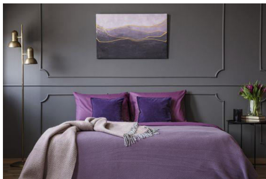
Figura 4. Dormitor în culori monocromatice întunecate