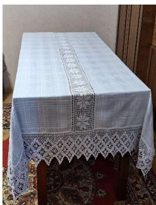
Figura 8: Față de masă, Casa Mare, dna Parascovia, 75 ani, s. Roșcani r-ul Strășeni