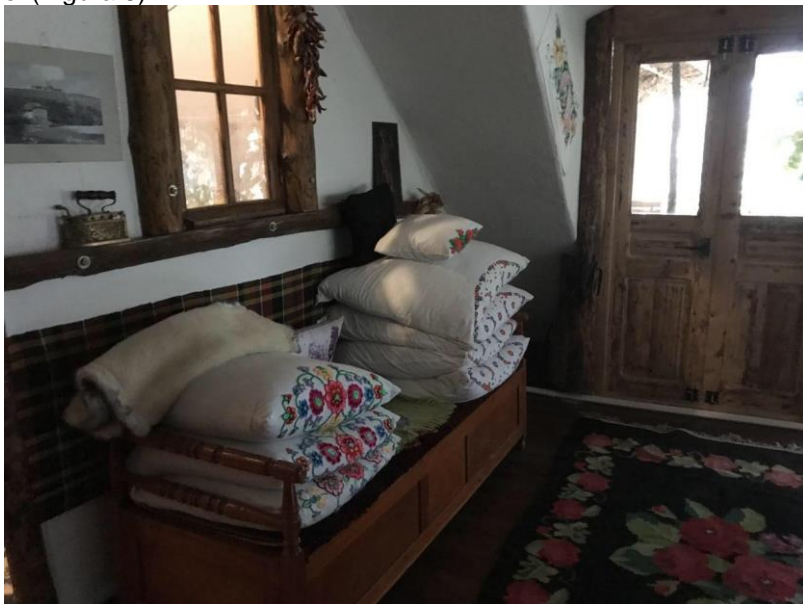
Figura 6: Zestre păstrată pe și în sofcă.

se decora și cu horboțică, peste care se așternea un țol tip cuvertură țesut în dungi sau vârste, din fir de lână. La fel, pe pat se aranjau pernele suprapuse una peste alta în 2-3 rânduri, care erau ornamentate în diverse tehnici. Numărul pernelor care era destul de mare, de la 10-12, de asemeni era un indicator al bunei stări materiale a familiei și iscusinței gospodinei casei (Figura 6).