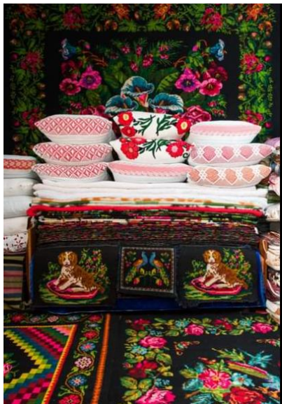
Figura 9.

zestre piese prețioase de artă populară și străduinței lor de a le proteja și păstra, contemporanii noștri au șansa să vadă în case, în muzee obiecte create de diferite generații și din vremuri demult apuse. Prin ele continuă să trăiască amintirea despre cei plecați în veșnicie. Obiectele rămase de la strămoși conțin în sine deosebite mesaje și informații pentru noi.