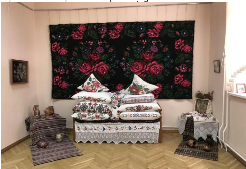
Figura 1: Imaginea de ansamblu asociată Casei Mari, Expoziția personală Grigoraș Liudmila. Pinacoteca „Antioh Cantemir”, or. Bălți

Astfel, fiecare gospodină își organiza Casa Mare cu textilele moștenite ca zestre sau confecționate de ea însăși, respectând tradiția și codul esteticii populare, iar obiectele erau amplasate în dependență de funcționalitatea acestora și rolul lor. Prin urmare se observă că preferințele pentru amenajarea casei se referă la: colțul cu icoana, zona patului cu lada de zestre, zona cu masă, covorul de perete și grinzile.