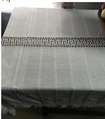
Figura 7: Față de masă, Muzeul Ținutului Cahul

Din datele culese de pe teren, în cele mai grele și sărmâne timpuri, mesele se acopereau cu un lat de pânză scurtă, decorate numite „drumuri” [6], peste care se așeza chiseluța cu dulciuri, prăjituri. Pe măsura ce familia era mai înstărită, sau gospidina era mai pasionată, dedicată, ambițioasă fețele de masă erau mai complexe atât prin desenele reproduse prin țesere, cât și a complexității horboțelilor utilizate. Fețele de masă astfel variau ca caracteristici dimensionale, fiind realizate din două laturi de pânză/prosoape, îmbinate între ele printr-un registru pe mijloc din horboțică numit „încheietură” și decorate de jur-împrejur cu hornoțică de diferită complexitate (fig. 7.)