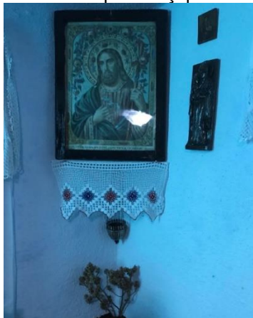
Figura 2: Icoana Muzeul de Istorie, s. Pârlița, r-nul Ungheni

Icoana era decorată cu o pânză din bumbac brodată cu diverse ornamente florale în culori vii de forma literei „U”, întors (fig.3,4) care se fixa la linia tavanului astfel încât să treacă cu 2-3 cm peste rama icoanei. Alte gospodine decorau icoana cu un prosop sub formă de fluture, fixat deasupra icoanei la mijloc într-un punct, părțile prosopului fiind lăsate liber în jos, trecând pe după liniile laterale ale icoanei. Deseori pentru icoana se realiza un prosop special, numit prosopul pentru icoana (fig. 4.), având reproduse prin tehnicile de coasere simbolurile religioase cum ar fi crucea. Același simbol era reprodus și prin tehnica de croșetare în horboțică. Adesea, la