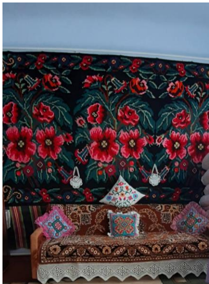
Figura 10: Covor moldovenesc cu 2 fețe, Zestre -anul 1971, s.Roșcani r-ul Strășeni.