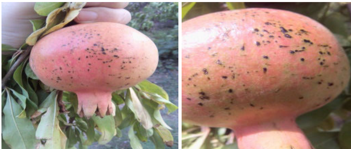
Рисунок 10-11. Сливающиеся пятна церкоспороза у сортов «Крмызы Кабух» и «Розовая Голоша»

пучками, размером 20-30x3 мкм. Конидии бесцветные, нитевидные или булавовидные, с 2-5 перегородками, размером 30-56x3-3,5 мкм.