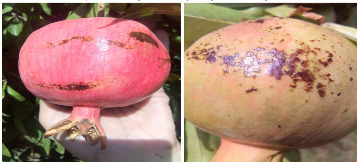
Рисунок 8-9. Церкоспороз созревающих плодов граната сорта «Розовая Гюлоша»

Распространенность церкоспороза граната ( Cercospora lythracearum Heald. Et Wolf.) в гранатовых садах восприимчивых сортов при наличии благоприятной погоды может достигать 100%. Такое интенсивное поражение гранатовых кустов наблюдалось в 2018-2020 гг. на насаждениях сортов Крызы Кабух и Розовая Гюлоша в опытном саду Геранбойского района. Пораженные листья преждевременно опадали, отмечался вторичный рост верхушечных побегов (до 50%), что приводило к общему истощению и ослаблению кустов, а в зимний период к их подмерзанию и полной гибели.