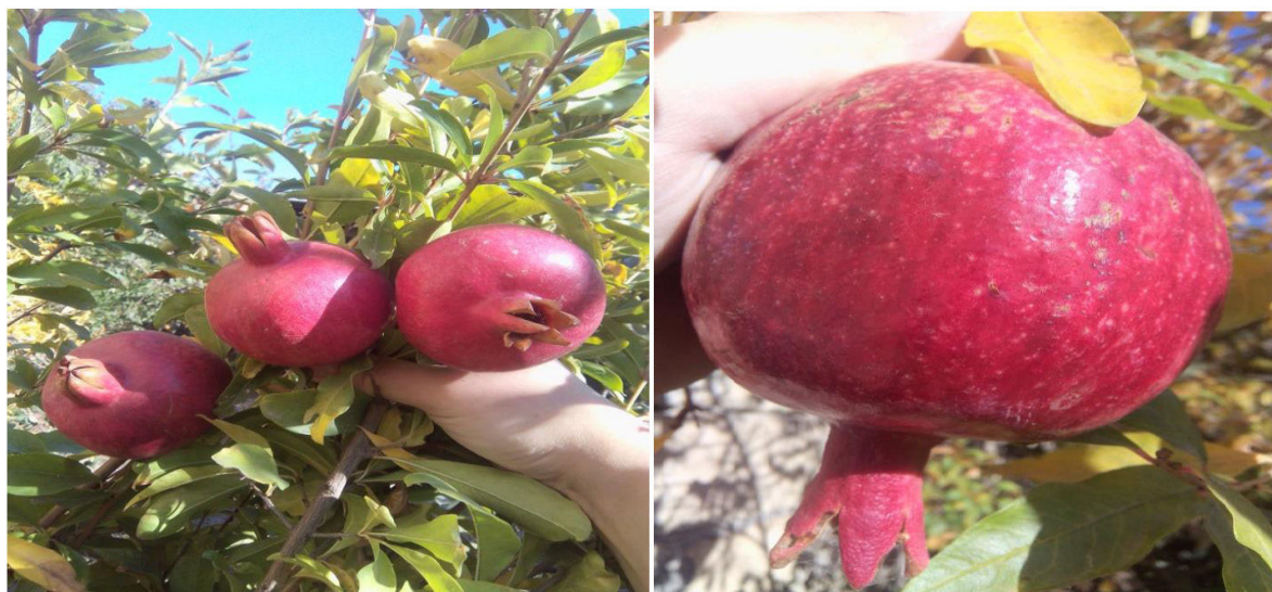
Рисунок 3-4. Местный Азербайджанский сорт «Крмызы Кабух»

Гранат ( Punica L. ) самая значимая субтропическая плодовая культура Азербайджана. Благодаря своим ценнейшим биологическим свойствам, привлекательному внешнему виду, аромату, изысканному вкусу плодов, высокой способности к хранению и транспортабельности она приобрела невиданную популярность и широкое распространение по всему Азербайджану (Гянджа-Казахская, Центрально-Аранская, Ширванская географические зоны). Благодаря наличию сортов с ранним, средним и поздним сроками созревания, плоды граната можно употреблять в пищу в течение всего года, а продукты переработки граната всегда пользуются высоким спросом.