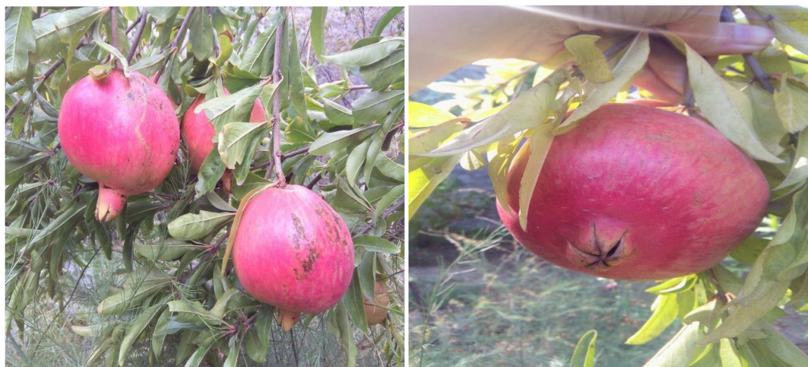
Рисунок 1-2. Гранатовый куст (местный сорт «Розовая Голоша»)