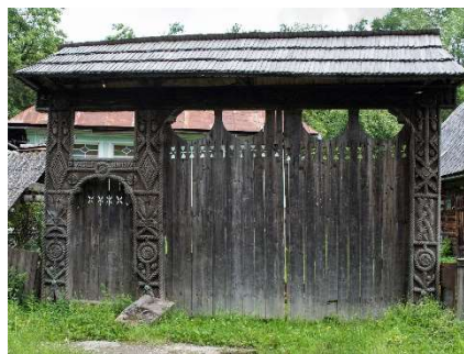
Figura 2. Poartă din lemn

Pe lângă case, frumoase motive se întâlnesc și pe porți: struguri de poamă, cocostârci, păstorul în straie naționale, butoaie, etc. afirmă L. Moisei [5, p. 274].