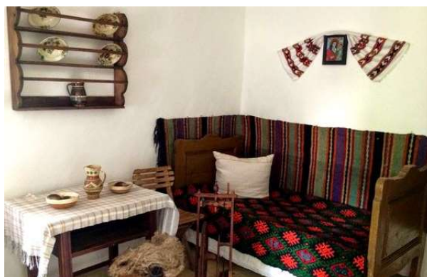
Figura 6. Mobilier țăranesc

Este necesar de a sublinia și faptul că obiectele de mobilier în interiorul țăranesc sunt obligatoriu în ansamblu cu țesuturile tradiționale precum: fețele de masă, proștirile de pat și de perete, fețele de pernă, covoarele, lăicerele de lână etc.