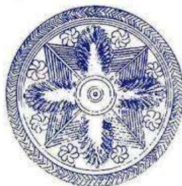
SIMBOL GETO-DACIC DE PE POARTA SANCTUARULUI DE LA SARMISEGETYZA

Motivul soarelui – este deseori reprezentat prin intermediul unui cerc cu un punct în mijloc, care de asemenea face trimitere la anii care se succed sau la evoluția ciclică a vieții (Figura 3.).