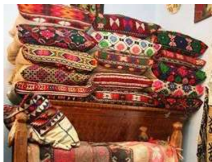
Figura 1. Țesături în interior