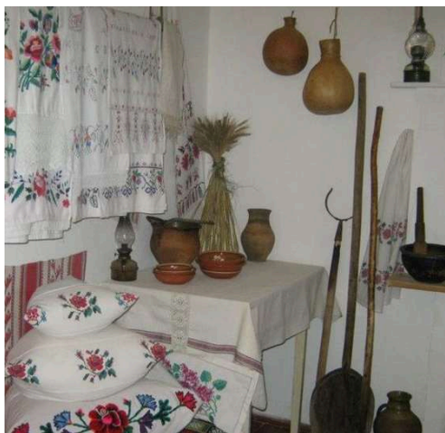
Figura 7. Țesături tradiționale

Fețele de masă sunt realizate din câte două lățimi de pânză, țesute cu vrâste sau cu modele năvădite, având dantelă pe mijloc și pe margini. Sunt ornamentate cu cusături cu arnici colorat (Figura 7).