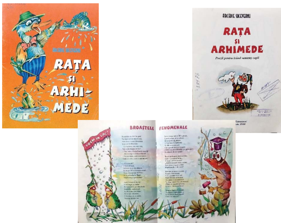
Grafica de carte pentru ediția „Rața și Arhimede”, de Arcadie Suceveanu (copertă, pagină de titlu, pagini de interior) [3]

În interior, imaginile înfățișează personajele pline de umorul caracteristic maestrului Sergiu Puică, ce uimesc prin acuratețea reprezentării, fiind parcă direct desprinse din poeziile lui Arcadie Suceveanu. În acest sens, Leo Bordeianu afirmă că „ilustrațiile lui sunt niște povești în imagini. Căci numai poveștile pot purta o asemenea încărcătură de bunătate, sinceritate, optimism, încredere în forțele proprii” [6]. Imaginile echilibrate sunt amplasate în mare parte în dreapta textului, cu unele ilustrații dispuse pe desfășurata a două pagini alăturate sau uneori intercalate cu textul poeziei.