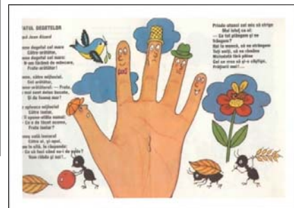
Grafica de carte din colecția „Micile Americi”, volumul „Necazul ariciului”, de Iurie Colesnic [6]