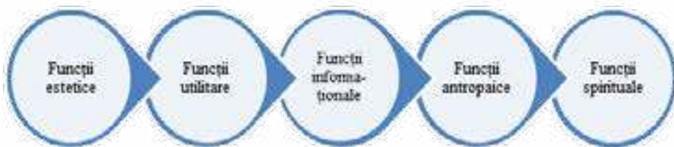
Figura 1. Funcțiile cămășilor tradiționale

Toate funcțiile atribuite cămășilor tradiționale, denotă valoarea lor, poziționându-le dincolo de produse cu funcții utilitare, primând funcțiile estetice, informaționale, antropice, spirituale în cămașele pentru sărbătoare mai mult decât cele utilitare. Deși nu au fost neglijate, funcțiile utilitare, asigurate prin soluțiile constructive aplicate, tehnicile de îmbinare amplifică valoarea lor. Esteticul cămășilor tradiționale determinat de motivele ornamentale aplicate, prin semnificația și forma elementelor reproduse, cu rol spiritual, filosofic existențial, antropic, completează, intensifică puterea și importanța lor. Toate, în același timp, cu spiritul fiecărei meșterite pus în fiecare element tehnic din care s-au născut elementele compoziționale, dispuse în registre ornamentale de o exelație (?) vibratorie ritmică și cromatică irepetabilă. Ele reprezintă spiritul purtătoarei/purtătorului pus în lumină cu multă modestie și discreție.