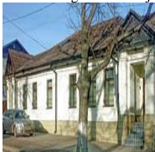
Fig.1 or. Chișinău , str. 31 August 1989,nr32

Monumente demolate sau încălcări în protejarea patrimoniului sunt prezentate în imaginile de mai jos: