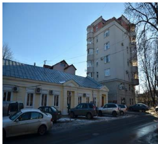
Fig.2 or. Chișinău, intersecție str. București și str. Armenească