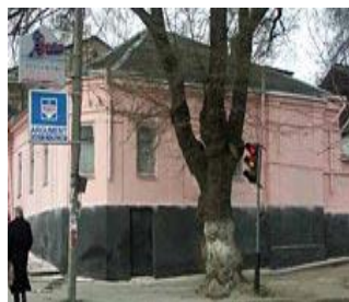
Fig. 5 or. Chișinău, str.Alexandru cel Bun,nr.91