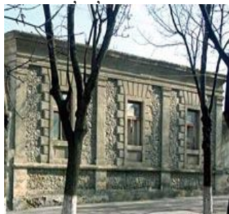
Fig.4 or. Chișinău, str. Serghei Lazo, nr.22