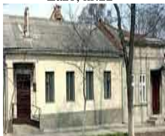
Fig. 6 or. Chișinău, str. Vlaicu Pîrcălab,nr.7