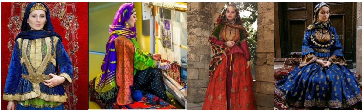
Рисунок 2. Национальная одежда различных регионов Азербайджана

Народная одежда является фактором, влияющим на идентификацию народа, в национальной культуре. Народная вышивка, декор изделий с художественной вышивкой, художественно-конструктивное решение формы костюма (как в костюме у Хуршуд бану Натаван), использование набивных тканей с элементами фольклора, т.е моделирование костюма на основе особенностей национальных традиций рис.3.