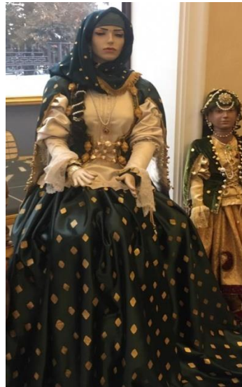
Рисунок 1. Национальная одежда поэтессы Хуршуд Бану Натаван