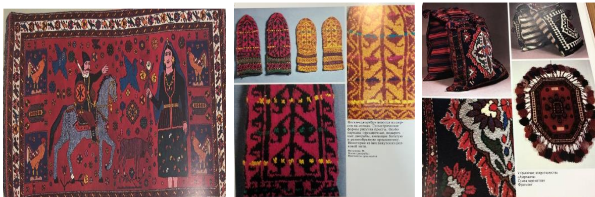
Рисунок 3. Виды декоративно-прикладного искусства

Народная одежда является фактором, влияющим на идентификацию народа, в национальной культуре. Народная вышивка, декор изделий с художественной вышивкой, художественно-конструктивное решение формы костюма (как в костюме у Хуршуд бану Натаван), использование набивных тканей с элементами фольклора, т.е моделирование костюма на основе особенностей национальных традиций рис.3.