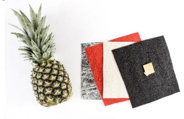
Figura 2. Material Pinatex

În timp ce multe alternative de piele pe bază de plante sunt încă în faza de prototip, Piñatex a fost deja transformat în produse disponibile.