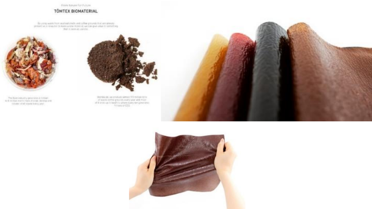
Figura 3. Material Tomtex

Designerul olandez Tjeerd Veenhoven s-a orientat spre fibre vegetale pentru a-și crea piele vegană , la fel ca Piñatex, deși a optat pentru a-l obține din frunzele palmei de areca în loc de ananas.