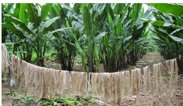
Figura 1. Fibre din plante de banane

Biofabricarea este despre experimentarea chimiei și naturii. Câteva exemple includ sistemul vegan de izolare a zgomotului realizat din ciuperci sau căutarea de piele sintetică, a cărei cerere a crescut cu 119% în ultimul trimestru al anului 2018, conform raportului Year in Fashion 2018. Noul tip de „mătase” vegană este produsă chiar din fibre din plante de banane (Fig.1.), și nu din viermi de mătase, iar pulpa fabricată din frunze de dud poate fi folosită pentru a acoperi bumbacul, rezultând pielea lăcuită.