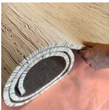
Figura 5. Linoleum din uleiuri si plută măcinată