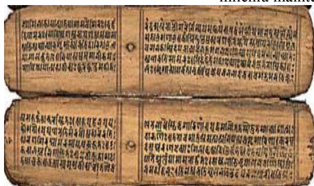
Figura 2. Sanscrita.