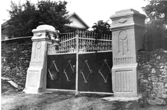
Figura 5. Poartă. s. Piatra (Orhei).

Pentru asigurarea rigidității sistemului de elemente orizontale și verticale ale acoperișului, deseori sunt aplicate contrafisele. Acestea, pe lângă asigurarea stabilității sistemului de construcție joacă și un rol decorativ expresiv.