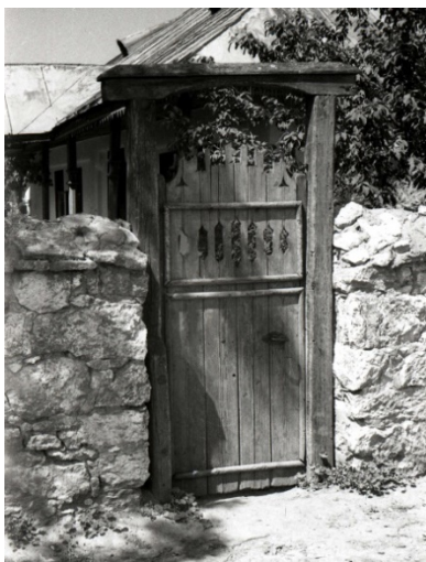
Figura 1. Porțiță de lemn. s. Cunicia (Camenca).

Structura compozițională a porților poate fi clasificată în baza anumitor particularități. Conform numărului de stâlpi porțile pot fi clasificate în două grupuri de bază: poartă alcătuită din doi stâlpi și poartă alcătuită din trei stâlpi. În acest caz porțița care indică trecerea pentru oamnei, poate fi plasată aparte de poarta mare (figurile 1 - 3), poate fi alăturată la unul dintre cei doi stâlpi (figurile 6 - 7) sau poate fi încadrată în una din aripile porții mari (figura 4).