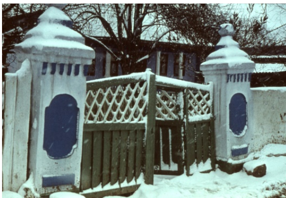
Figura 4. Poartă. s. Brănești (Orhei).

Coama acoperișului de deasupra porților, are un rând de șiță profilat în scop decorativ, cu denumirea populară ”ciocârlani” [1]. Capetele coamei sunt împodobite cu câte un bold ornamentat în traforuri. De cele mai multe ori partea superioară a acestuia capătă siluete de flori plante sau arbori asociate cu figuri de păsări sau capete de cai. Deseori centrul coamei este împodobit cu elemente de decor care încoronează acoperișul dându-i eleganță și grațiozitate.