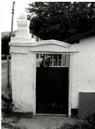
Figura 2. Portiță adosată. buiandrung. s. Mașcăuți (Criuleni).