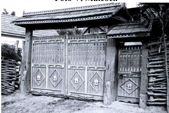
Figura 7. Poartă. s. Dereneu (Călărași).

Din terminațiile cu forme simple fac parte cele mai vechi mostre de acest tip. Dintre ele cele mai recent întâlnite sunt: terminații de formă rotunjită, care în unele cazuri tind să capete forme mai evoluate, sub chip antropomorf; terminații sub formă de piramidă în