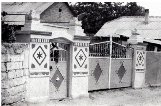
Figura 6. Poartă. s. Butuceni (Orhei).

Element important în decorul porților și porțițelor constituie terminația coronamentului stâlpilor. Aici depistăm un repertoriu divers de forme care pot fi clasificate în: terminații cu forme simple și terminații cu forme compuse.