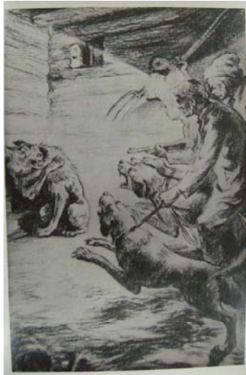
Fig. 2. Iacob Averbuh. Ilustrație la fabula lui I. Krîlov «Волк на псарне», 1953.