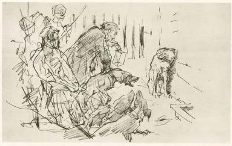
Fig. 1. V. A. Serov. Ilustrație la fabula lui I. Krîlov «Волк на псарне» („Lupul la cotet?”), 1951.