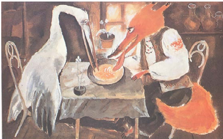
Fig. 6. Arii Sveatcenko. Ilustrație la fabula „Cocostârcul și vulpea” de G. Asachi, 1978.