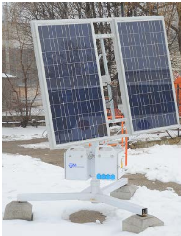
Fig. 4. Sistem autonom fotovoltaic cu orientare automatizată (SFVI).

Orientarea la soare se efectuează prin acționarea simultană a motorului pas cu pas a modului și servomotorului solar al modului său. Astfel, panourile fotovoltaice se orientează la soare prin re poziționarea acestora cu mișcare plano-paralelă. Acționarea în ansamblu a panourilor fotovoltaice este ireversibilă, fapt ce asigură imobilitatea acestora la acțiunea vântului.