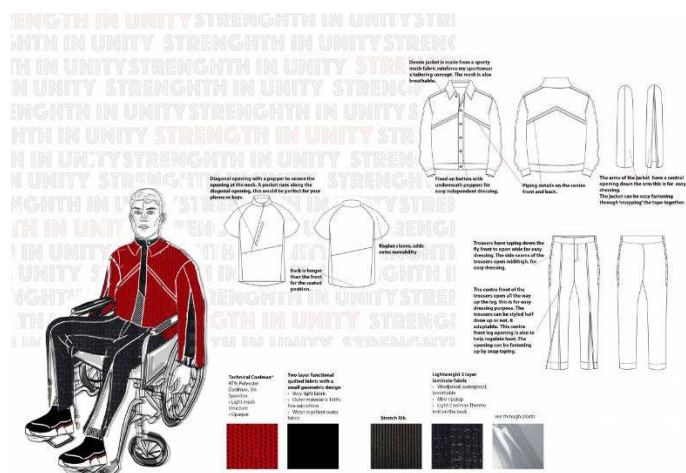
Figura 3. Produse pentru persoane în scaun cu roțile/cu paralizie cerebrală

Îmbrăcăminte pentru persoanele cu sindromul Down. [1,8,9]. Persoanele cu sindromul Down au o mobilitate scăzută, o structură și o formă specifică a corpului (figură în formă de pară, cu umeri înclinați, înguști, picioarele și brațele scurte). De asemenea au și o imunitate mai slabă, iar îmbrăcăminte ar avea și un rol de protecție și ar trebui să fie cât mai închisă. Se propune utilizarea unor gulere mai înalte pentru a proteja de vânt, iar figura se corectează cu materiale moi, care se adaugă în diferite zone unde este necesar. La pantaloni se recomandă utilizarea benzilor elastice. Elastice, clape, magneți, nasturi mari, fermoare, benzi Velcro fixează totul, de la cămăși, rochii și pelerine de ploaie până la costume de înot și pijamale pentru persoanele cu sindrom Down. Țesături confortabile, cusături plate, produse fără etichete și lipsa buzunarelor din spate împiedică stresul senzorial și leziunile pielii. Adidașii cu fermoare și închideri de fixare fac pantofii mai ușor de manevrat. Pentru persoanele cu sindromul Down se face, pe baza specificului figurii, o grilă dimensională care facilitează semnificativ alegerea hainelor. (Figura 4)