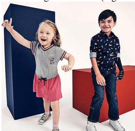
Figura 4. Produse pentru persoane cu sindrom Down și persoane cu tulburări ale spectrului de autism

Îmbrăcăminte pentru persoanele cu sindromul Down. [1,8,9]. Persoanele cu sindromul Down au o mobilitate scăzută, o structură și o formă specifică a corpului (figură în formă de pară, cu umeri înclinați, înguști, picioarele și brațele scurte). De asemenea au și o imunitate mai slabă, iar îmbrăcăminte ar avea și un rol de protecție și ar trebui să fie cât mai închisă. Se propune utilizarea unor gulere mai înalte pentru a proteja de vânt, iar figura se corectează cu materiale moi, care se adaugă în diferite zone unde este necesar. La pantaloni se recomandă utilizarea benzilor elastice. Elastice, clape, magneți, nasturi mari, fermoare, benzi Velcro fixează totul, de la cămăși, rochii și pelerine de ploaie până la costume de înot și pijamale pentru persoanele cu sindrom Down. Țesături confortabile, cusături plate, produse fără etichete și lipsa buzunarelor din spate împiedică stresul senzorial și leziunile pielii. Adidașii cu fermoare și închideri de fixare fac pantofii mai ușor de manevrat. Pentru persoanele cu sindromul Down se face, pe baza specificului figurii, o grilă dimensională care facilitează semnificativ alegerea hainelor. (Figura 4)