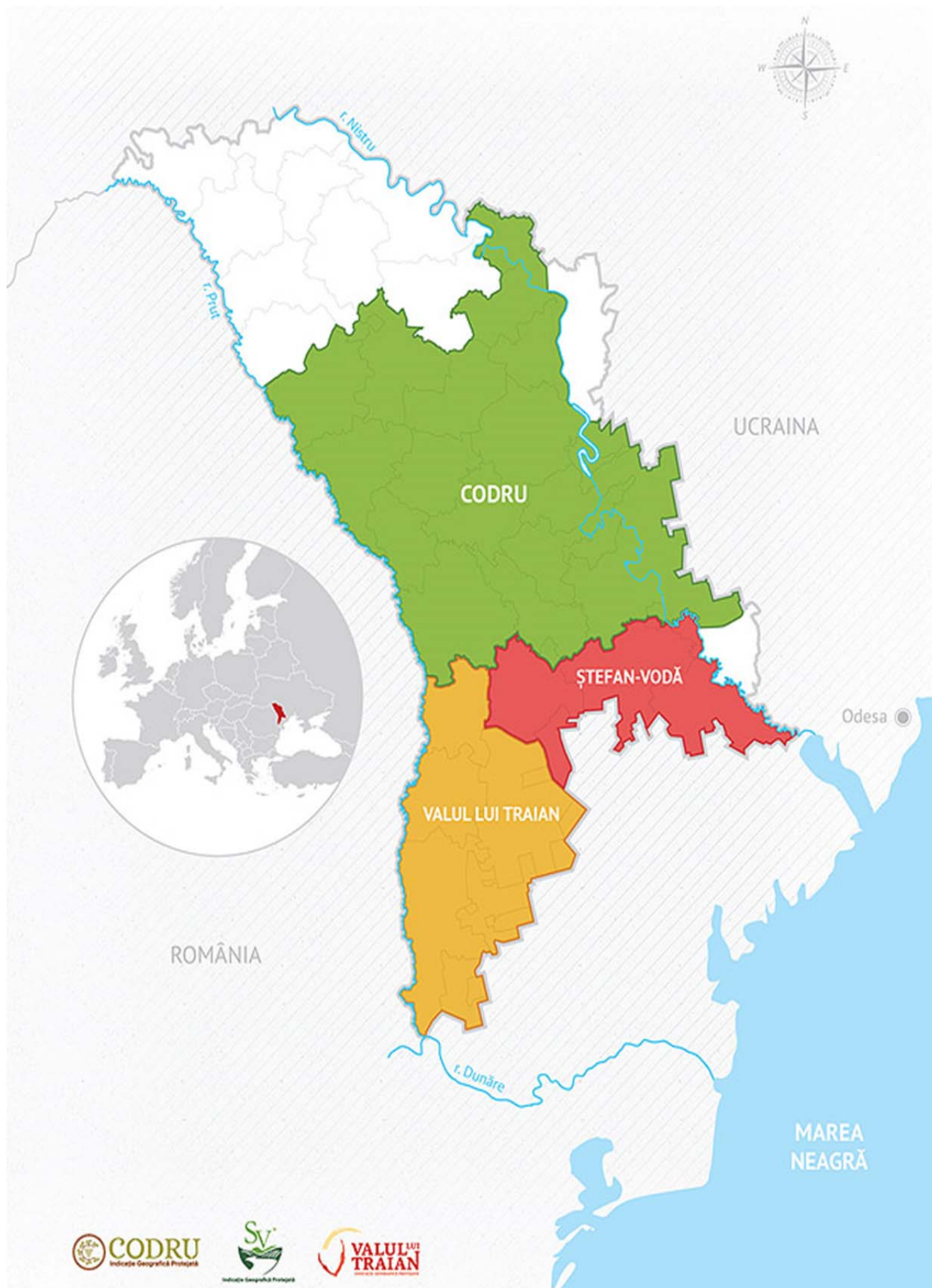
Figura 2. Harta Regiunilor cu Indicație Geografică Protejată din Republica Moldova.