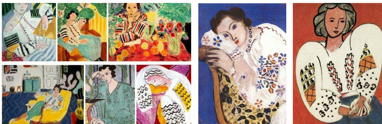
Figura 4. Schițe La Blouse Roumaine, La blouse roumaine de Henri Matisse

Fetele moșteneau de la bunici și mame nu numai tehnica de artă populară, ci și rugăciunile, care urmau a fi spuse în mod obligatoriu, înainte de a începe toarcerea lânii, de a țese sau a broda. Ia, reaprează mai multe etape de lucru, de la țesătura în sine până la broderiile complicate pe piept și pe mâneci, este realizată în întregime manual, și designul nu s-a schimbat de sute de ani. Această port popular, purtat la sărbători, a însoțit omul la toate evenimentele fundamentale ale vieții sale, de la naștere până la moarte. Este o emblemă a recunoașterii, un semn al identității etnice, un document cu valoare istorică și artistică indiscutabilă, figura 4 [14, 15].