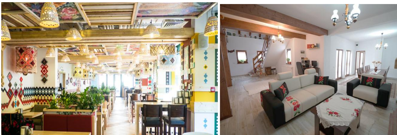
Figura 7. Valorificarea elementelor stilistice în interioarele contemporane

Bucătăria joacă un rol semnificativ în viața omului, fiind una dinamică și funcțională. Se poate realiza un joc de elemente și o îmbinare frumoasă de stil, folosind mobilierul pur contemporan și ornamente tradiționale pe perete, sau pardoseală sau bărne de lemn cu rol decorative pe tavan, obiecte ceramice cu rol decorative. Sau s-ar putea folosi un mobilier mai brutal și nefinisat cu o îmbinare de sticlă, calmând formele acestuia, figura 7, [10, 11, 14].