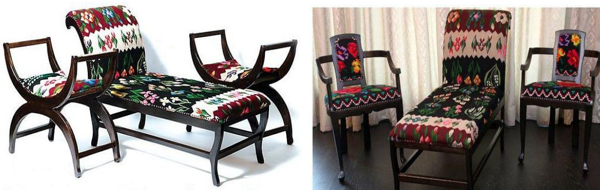
Figura 6. Mobilier contemporan tradițional românesc

Pentru a oferi un aer tradițional în interioarele contemporane, drept soluție reprezintă jocul cu elementele ornamentale ale stilisticii naționale pe tapițeria mobilierului, spre exemplu elementele covorului de lână stilizate cu linii contemporane, aspect care conferă multă căldură interiorului. Aceste combinații pot fi făcute și drept desen pentru gresia din bucătărie sau pentru pardoseli, la fel aceste îmbinări pot fi folosite pe suprafețe lemnoase, pentru spații sociale sau particulare. Proiectul „Dare to rug” din România a experimentat și a ajuns la unele modele foarte reușite pentru realizarea acestor idei, figura 6, [2, 3].