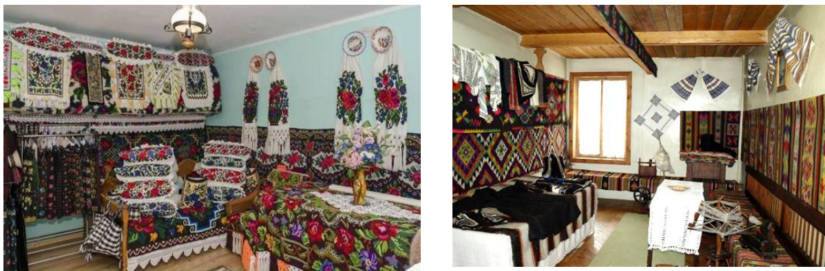
Figura 2. Complexitatea texturilor în locuințe țăărănești

Spațiile din locuința tradițională erau organizate în jurul unui centru de interes cu zonele: locul de luat masa, locul de reunire a familiei, iar apoi urmând să se dezvolte încăperile în jurul acestui punct central. Stilul tradițional românesc poartă o încărcătură puternică axată pe simbolismul ornamental al texturilor și țesăturilor, covorului, prosopului, al mobilierului incrustat ș.a., reprezintă un stil sustenabil din punct de vedere al folosirii corecte a resurselor. Structura spațială a locuinței tradiționale s-a perfecționat cu scurgerea timpului, a ierarhiei și dezvoltării sociale. Inițial acestea erau monocelulare, după care, în decursul timpului s-au dezvoltat formându-se în anexe în jurul camerei centrale și anume zonei de luat masa, iar mai apoi transformându-se în case bicamerale, tricamerale și multicamerale [7, 11, 12, 13].