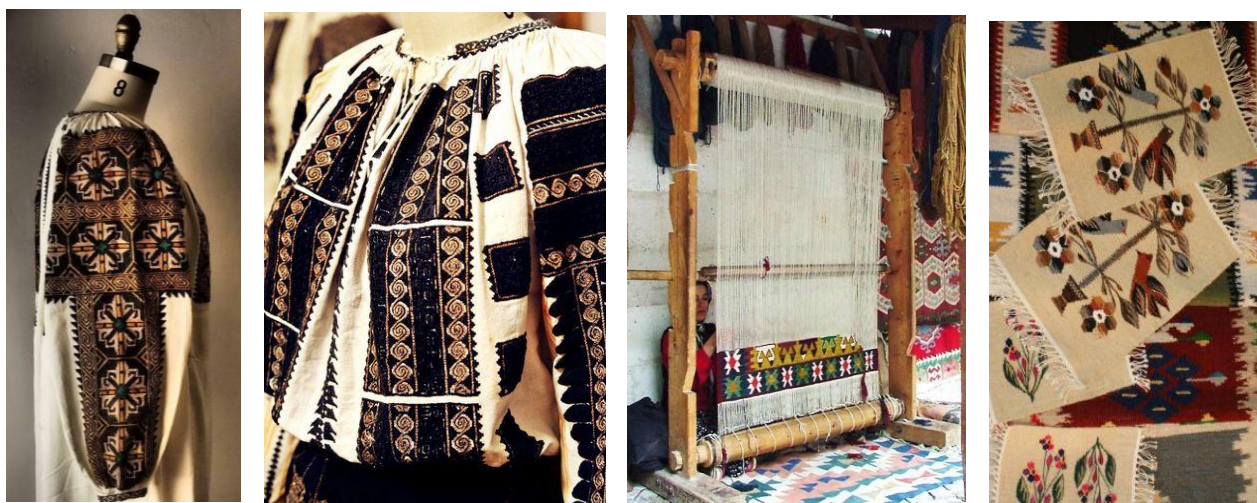
Figura 3. Portul național – ii, covoare și război de țesut

Reabilitarea portului național, prin reconstruire și readucerea acestui accesoriu vestimentar pe piață. Cunoscută sub numele de "ie", cămașa brodată cu mâneci este un tip de îmbrăcăminte, plină de semnificații și istorie se presupune că a fost purtată pentru prima dată de poporul Cucuteni-Tripolie. Desenele și broderiile, realizate în benzi ornamentale, ce caută un echilibru perfect, reprezintă simboluri magice care, cusute cu precizie, aveau rolul de a-i proteja pe cei, ce purtau cămașa, de spirite rele, vrăji și ghinion. Fabricată din in, cânepă, bumbac, brodată strict manual, în timp, ia a fascinat pictori, fotografi, designeri și personaje în toate părțile lumii. Astfel, pictorul francez Henri Matisse, a pictat lucrarea " La blouse roumaine " în 1940, inspirat de colecția de ii, primită de la pictorul român Theodor Palladi, figura 2, 3, 4 [5, 6, 7, 8].