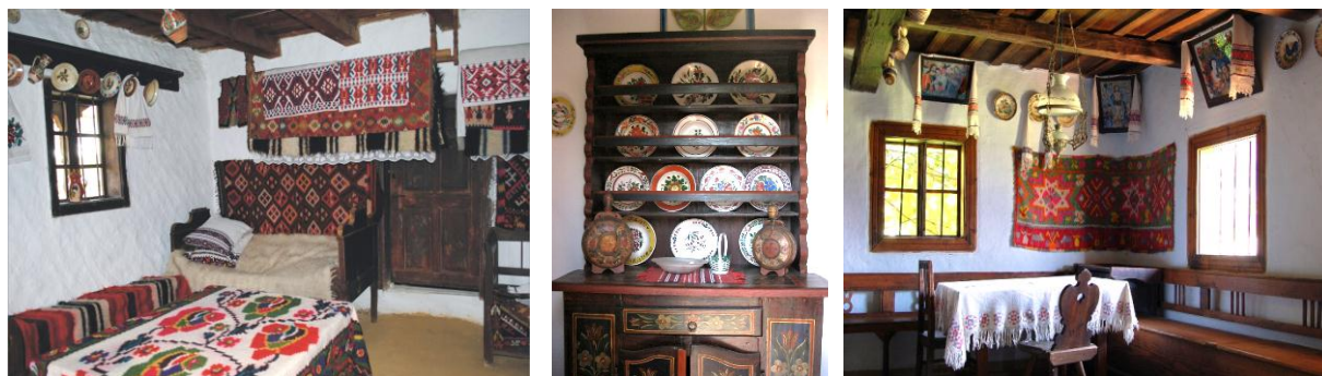
Figura 5. Interioare completate cu mobile tradițional

Cele mai semnificative piese de mobilier al stilului traditional sunt lavițele, patul țărănesc ce de obicei era amplasat opus vatrei, mesele și scaunele cu dimensiuni variate, polițele, blidarele, precum și lada pentru zestre. Acestea erau în general confecționate din lemn masiv, pictate și sculptate, dar se lăsa la vedere și structura esenței lemnoase. Spre exemplu, scaunele realizate prin retezarea trunchiului unui arbore, brațele și picioarele din ramuri crescute arcuit. În casele tradiționale, locul cel mai important din punct de vedere decorative era colțul în care era așezat patul, datorită țesăturilor, combinarea și gruparea lor, și nu neapărat a însuși patului, un covor țesut pe perete cu ornamente compexe, cu rolul de izolare termică, se așternea o cuvertură țesută și perne așezate una peste alta, o plina bogăție, figura 5, [2, 3].