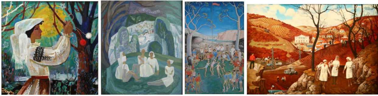
Fig. 5. Vieru Igor, „Mărțișor”, 1975, u/p., 100,6x103,3 cm., MNAM.