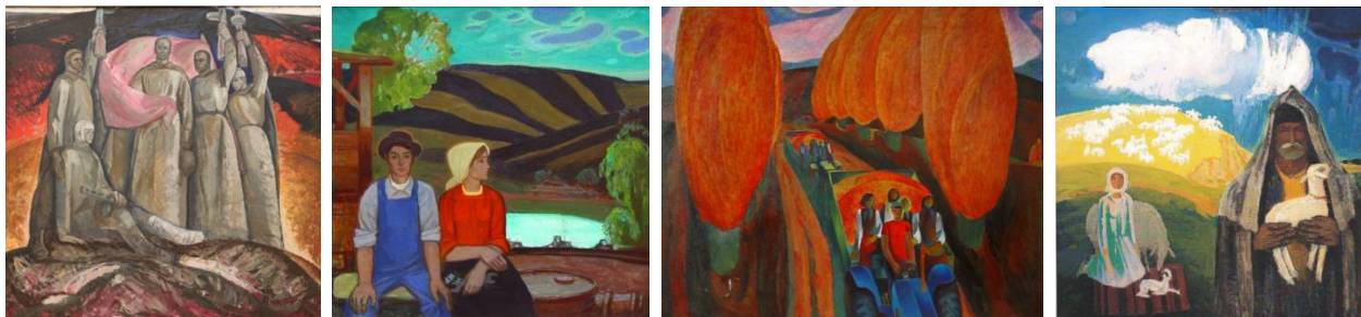
Fig. 1. Nichita Bahcevan, „Jurământ la altitudinea Lomachin” 1970, u/p., 146x142 cm., MNAM.

din tabloul „Răscoala de la Tatarbuniar” (1972) de Ion Stepanov (1935), suscitând o expresie dramatică și enegetico-dinamică, ce sincronizează mișcarea ritmică a figurilor. La o textură decorativ-artizanală ușor adaptată calităților ceramicii tradiționale, recurge formula plastică a figurativului din lucrarea „Printre consăteni” (1970) de Sergiu Cuciuc (1940), asociind armonios geometrizarea formelor cu tipizarea bucolico-etnografică a imaginii.