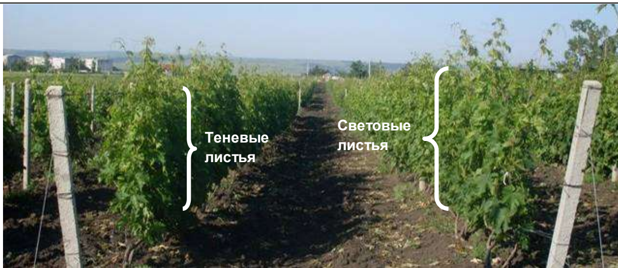
Рис.1. Расположение световых и теневых листьев в кроне у растений винограда при шпалерно-рядовой посадке. Направление рядов восток-запад.

В фазу цветения в световых и теневых листьях определяли содержание пластидных пигментов (хлорофиллов a , b и каротиноидов) на спектрофотометре. Концентрацию пигментов рассчитывали по формуле Винтерманс, Де Мотс (Степанов, Недранко, 1988), выражали в мг/дм 2 листовой поверхности. Рассчитывали индексы хлорофиллов (хл. a / хл. b ) и пигментов (хл. a + b / карот.). Регистрацию флуоресценции хлорофилла листьев проводили с помощью однолучевого хронофлуорометра «Флоратест» (при 3-х минутном режиме), который позволяет определить фоновый (F 0 ), «плато» (F pl ), максимальный (F p ) и стационарный (F t ) уровни ИФХ листьев (Байрак и др., 2008; Брайон и др., 2000; Романов и др., 2010).