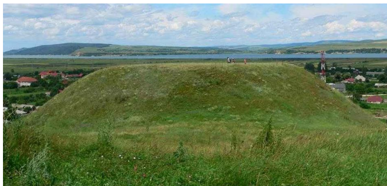
Fig. 2. Movilă tronconică de pământ cu rolul probabil de “Pat al lui Ro”.