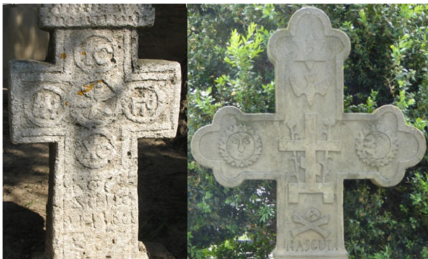
Fig.10. Imagini ale unor cruce care ar putea conține și informații precreștine.

În partea din stânga avem o cruce pe care se găsesc niște inscripții, care, în spiritul scrierilor din tăblițele de la Sinaia, ar putea fi interpretate astfel: -sus: YC - Ye Salio- îi înălțat sau s-a înălțat ; -jos: XC-Ho Steo , adică cel care stă sub cruce; în stânga: III – Nipe – Soarele, lumina ; iar în partea dreaptă avem KA-Kali , zeița întinericului sau a morții.