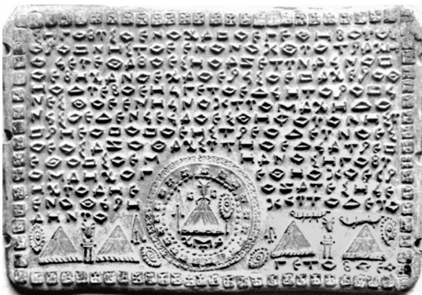
Fig. 1. Tăblița 109. Războinicii geți situați spre nord-est față de zona Traciei.

În tăblițele de la Sinaia există relatări care aduc unele clarificări privind semnificația unor vestigii istorice din zona carpato-danubiană și balcanică a Europei, dar și despre existența unor simboluri religioase care se întâlnesc și astăzi în viața religioasă a locuitorilor din această zonă. Una dintre tăblițele cele mai importante, din acest punct de vedere, este tăblița 109, figura 1, în care avem informații textuale dar și imagini legate de tematica analizată.