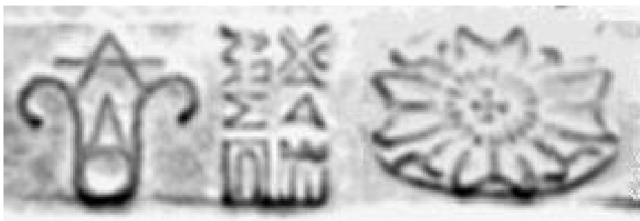
Fig.8. Detaliu din tăblița 13 care conține o imagine cruciformă.

În unele din tăblițele de la Sinaia există imagini care conțin și simbolul crucii. În figura 8 este redat un detaliu de pe chenarul tăbliței 13 care conține un astfel de simbol, care se mai regăsește și pe chenarul tăblițelor 15, 52, 80, 120, 122 și 128. Aceste detalii pot fi considerate ca fiind caracteristice tăblițelor realizate de însuși Deceneu. Mai trebuie menționat faptul că astfel de simboluri pot fi întâlnite și pe ceramica de tip Cucuteni; astfel de cazuri pot fi observate în figura 9.