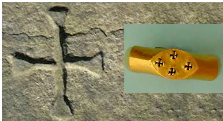
Fig.11. Imagini ale unei cruci de la Corbii de Piatră și a unor cruci imprimate pe un inel de la Apahida atribuit gepizilor.

Astfel de cruci au fost găsite și la Orheiul Vechi din Basarabia. De asemenea, este cunoscută reprezentarea unor cruci pe steagurile sau îmbrăcămintea cavalerilor teutoni, ioaniți, a cavalerilor de Malta, etc. Considerațiile de mai sus pun în evidență importanța civilizației carpato-danubiene și balcanice pentru istorie.