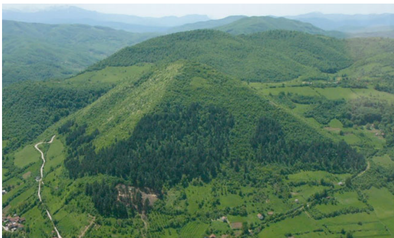
Fig. 4. Piramida din Bosnia-Herțegovina.

Herțegovina care se încadrează tot în zona geografică în care este situată și țara noastră. Astfel de piramide constituiau locuri de venerație către zei. Se știe din tăblița 2 că Zamolsxis a călătorit în Egipt unde a urcat pe piramide. În afară de aceasta, există lucrări în care se afirmă că piramidele din Egipt au fost construite de atlanți, care au fost predecesorii geto-dacilor. La noi, pot fi remarcate construcții piramidale prin ajustarea formei unor dealuri sau vârfuri de munte cum este cazul muntelui Ceahlău, sau Muntomanul Bucegi. De asemenea există cazuri unde este amenajată doar o față a piramidei cum este cazul din spatele mănăstirii Sucevița. În figura 5 este prezentată o construcție piramidală de la intrarea în localitatea Petru Vodă, pe partea stângă a drumului dintre Tg. Neamț și Poiana Largului. Astfel de forme piramidale pot fi observate și în alte zone, de exemplu, în ținutul secuiesc, lângă localitatea Horodiștea ș.a. Cuvântul “piramidă” ar putea proveni din expresia: “ pie Ra mi Deo – iubitul Ra al meu Zeu ”.