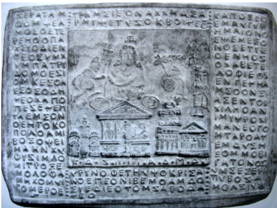
Fig.6. Tăblița 17. Aducerea capului lui Ion al Geei la Sarmisegetuza.

Semnificativă pentru religia geto-dacilor și comportamentul populației este tăblița 17, conform notației din cartea lui Romalo, prezentată în figura 6, al cărei text transcris cu ajutorul alfabetului latin și tradus este dat mai jos: