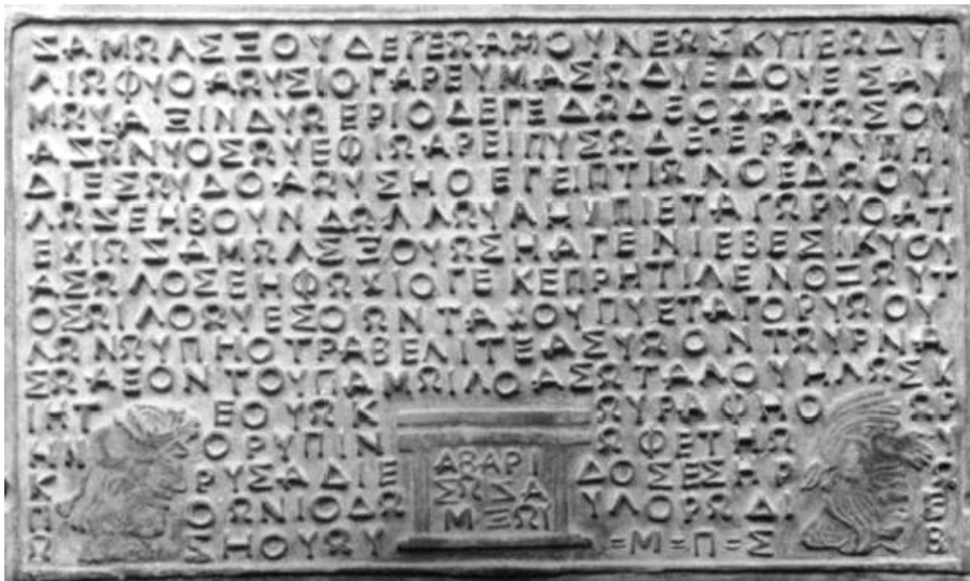
Fig.7. Tăblița 2. Săgetarea lui Zamolsxis și călătoria în Egipt.

Cele mai importante informații despre Zamolsxis sunt date în tăblița 2 (figura 7).