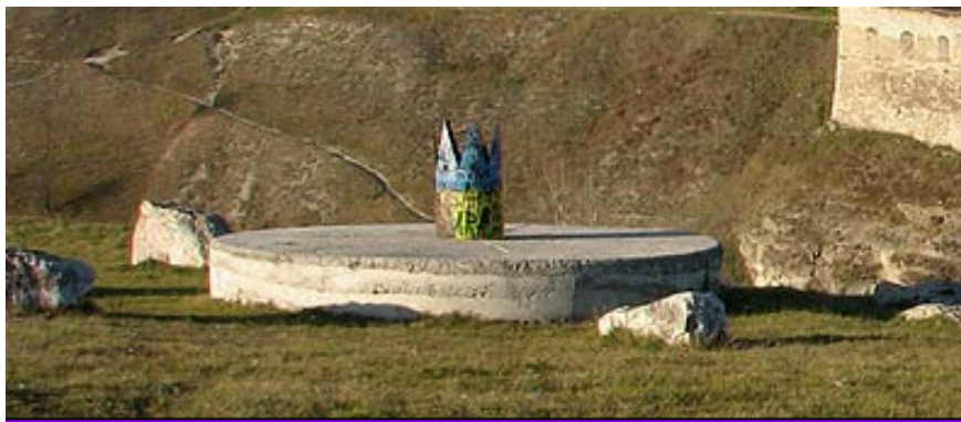
Fig. 3. Platou circular de piatră de lângă cetatea de la Camenița.

Este posibil ca suprafața plată de pe movilele tronconice să fi fost acoperite cu bucăți de piatră pentru a rezista la foc. De la astfel de amenajări, este posibil să provină denumirea unor localități cum sunt Petrodava, Petridava sau Camenița. Însăși antroponimul “ Petru ” ar trebui să provină de la acest “ Pato Ro ”. De asemenea, în unele locuri, astfel de “Paturi ale lui Ro” au fost construite din piatră direct pe sol, fără înălțarea unei movile. Un astfel de caz este cunoscutul “ Soare de andezit ” de la Grădiștea de Munte, unde a fost un sanctuar al lui Ro, după cum se poate deduce din tăblița 120 [4]. Însă, astfel de platouri au mai existat sau există și în alte locuri. De exemplu, undeva în zona dintre Brașov și Făgăraș a existat un platou circular din piatră, dintr-o singură bucată, mai mare decât cel de la Sarmisegetuza, care, după trecerea timpului, nu a mai putut fi localizat. În schimb, la Camenița-Ucraina de astăzi, există un astfel de platou de dimensiuni mari, format din 7 segmente și înconjurat de alți 7 tamburi mai mici, reprezentat în figura 3. Camenița este situată cam la 15 km de cetatea Hotin și, din informațiile obținute, ar rezulta că în vechime s-ar fi numit “ Petridava ”. Este posibil ca evenimentele descrise în tăblița din figura 1 și în tăblița 67 să se fi petrecut în acest loc