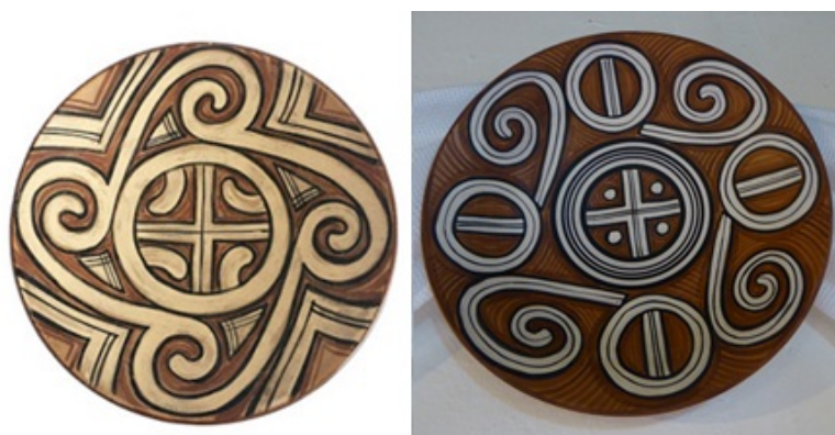
Fig.9. Imagini cruciforme pe ceramică de tip Cucuteni.

În unele din tăblițele de la Sinaia există imagini care conțin și simbolul crucii. În figura 8 este redat un detaliu de pe chenarul tăbliței 13 care conține un astfel de simbol, care se mai regăsește și pe chenarul tăblițelor 15, 52, 80, 120, 122 și 128. Aceste detalii pot fi considerate ca fiind caracteristice tăblițelor realizate de însuși Deceneu. Mai trebuie menționat faptul că astfel de simboluri pot fi întâlnite și pe ceramica de tip Cucuteni; astfel de cazuri pot fi observate în figura 9.