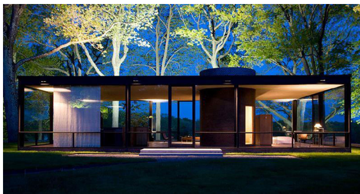
Рисунок 5. «Стеклянный дом». Людвиг Мис ван дер Роэ

Минимализм, идущий по пути, отличному от искусства в архитектуре и дизайне, создал свое выражение с помощью твердых геометрических форм, возложив на объект задачу функции. В 1960-80-е годы акцент на простоту и незамысловатость, а также использование белого цвета были обеспечены очень большими просторными пространствами с совместными проектами магазинов, выполненными модельерами и архитекторами. Этот подход позже повлиял на дизайн жилых домов, и были спроектированы минималистичные дома, в которых белый цвет использовался с геометрическими формами. Он был интерпретирован как минималистские интерьеры такими архитекторами, как Тадао Андо, Джон Поусон, Альберто Пазса. Для того, чтобы изучить концепцию минимализма здания, недостаточно посмотреть на планировочное решение, расположение пространства и эффект фасада. Кажется, что это более точный и достаточный способ посмотреть на количество используемых элементов (стены, перекрытия, колонны, балки и т. д.), разнообразие цветов и материалов, а также количество разделения пространства. Минимализм в эффекте фасада можно понять, посмотрев на количество и соотношение горизонтальных и вертикальных линейных или поверхностных элементов, воспринимаемых на фасаде, тип используемого материала и цвета, а также то, как они конкретно отражаются в форме.