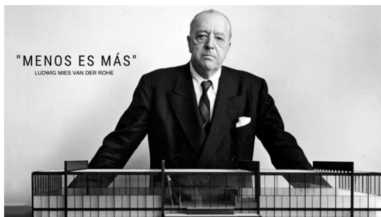
Рисунок 4. «Меньше, значит больше». Людвиг Мис ван дер Роэ

Фразу “Меньше, значит больше” Миса ван дер Роэ невозможно не связать с De Stijl Пита Мондриана. Это художественное направление расширило идеи выражения, тщательно расположив основные элементы, такие как линии и плоскости, используя основные цвета, простые формы и геометрию.