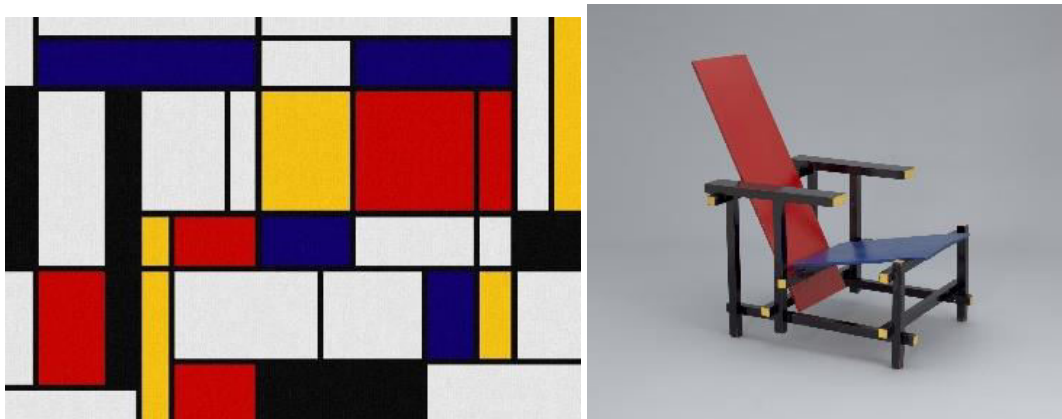
Рисунок 3. Композиция Пита Мондриана из «красного, желтого и синего» стула Геррита Ритвельда

Истоки минималистской архитектуры начались со школы Баухаус, и главным акцентом на ней был акцент на функционализме. Движение De Stijl также оказало большое влияние на это движение. Пит Мондриан, Тео Ван Дусбург, Геррит Ритвельд были пионерами подхода, который использовал чистые цвета, которые сводились к основным элементам в живописи, дизайне и архитектуре, сводили формы к их простой геометрии и, в конечном счете, стремились к целостности и совершенству в простоте.