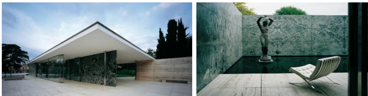
Рисунок 2. Павильон Barceleno. Людвиг Мис ван дер Роэ

Основатель этого направления Мис ван дер Роэ минимизировал материалы, используя сталь и стекло, которые он редуцировал до прямоугольных форм, и его понимание принципа «Меньше значит больше» с павильоном Barceleno на Всемирной выставке в Барселоне в 1929 году также находятся в полной гармонии с концепциями минималистичного искусства. Простые, но мощные материалы, такие как мрамор, прозрачные, но тонкие и элегантные, как стекло, составляют это пространство. Эта работа привела к концепции минимализма, глобальной тенденции, применяемой к таким секторам, как искусство, мода, дизайн и писательство.