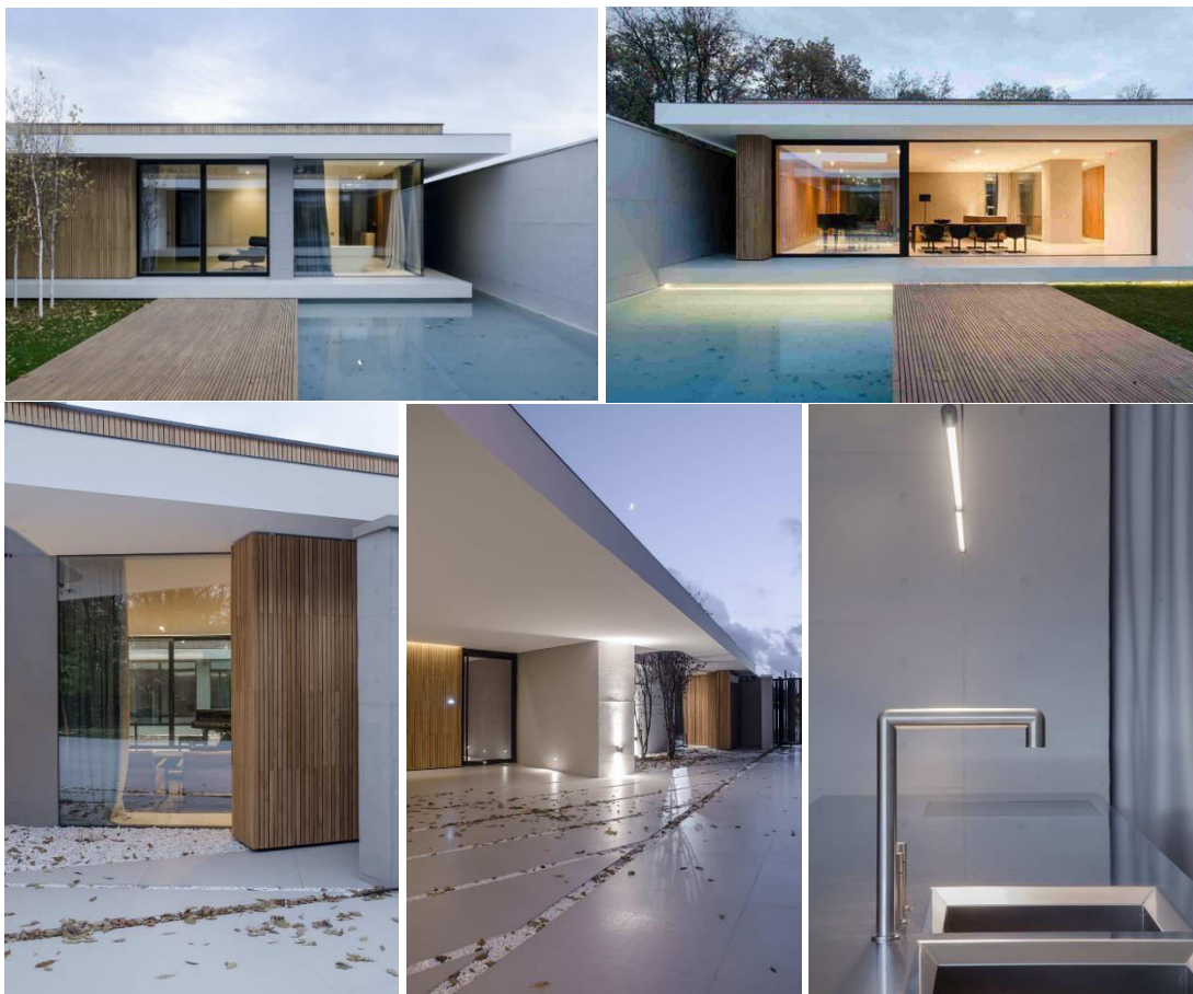
Рисунок 7. Пример дома из Молдовы

Интерьер, выполненный в минималистичном и умеренном стиле, создает атмосферу спокойствия и чистоты, подчеркивая практичность каждого пространства. В итоге, описанный дом представляет собой удачное сочетание эстетики и удобства, где форма соответствует функциональности, а минимализм придает проекту свой неповторимый характер и стиль.