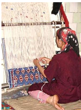
Fig. 3 Tehnica Ikat [2]

Tigru și elefant, frunze de betel, o fată dansînd și un elefant – acestea sunt doar cîteva motive expresive de pe țesăturile realizate în tehnica Ikat [3]. Ea se deosebește prin faptul că anumite fire sunt legate pentru a nu fi vopsite. Această tehnică presupune gîndirea prealabilă foarte minuțioasă a coloritului și motivelor ornamentale. Firele pentru urzeală și bătătură se împart în pachete structurate și pînă la începutul procesului de vopsire pe ele se depune desenul. În funcție de ornament firele se leagă în locurile unde trebuie să se păstreze culoarea inițială, restul se vopsește. Procesul se repetă pentru fiecare culoare în parte, de la nuanțe deschise la închise pînă cînd se obține desenul dorit. Astfel se pregătesc firele. Apoi ele se instalează în războiul de țesut și încetul cu încetul firele bogat vopsite în mod misterios se transformă în motive ornamentale, floristice sau antropomorme.