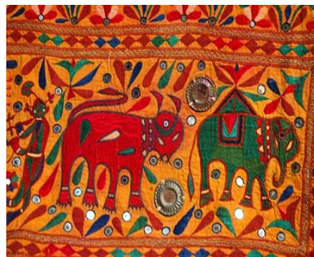
Fig. 5 Textil de Gudjarat [2]

Acest tip de țesut a fost răspândit în statele din Gujarat, Andhra Pradesh și Orissa, și în fiecare dintre ele s-au dezvoltat propriile metode de lucru. În Gujarat, se specializează în așa-numitul dublu-Ikat – cînd atît firele de urzeală, cît și cele de bătătură se leagă și se vopsesc separat, în funcție de particularitățile imaginii. În Orissa, în tehnica Ikat se realizează țesături din mătase sălbatică, decorate cu păsări stilizate, animale, flori sau figuri geometrice [2].