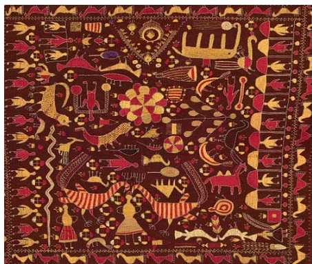
Fig. 4 Țesătură realizată în tehnica Ikat [2]