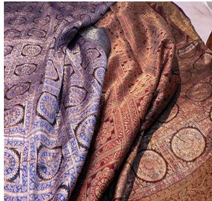
Fig. 2 Mătase de Benares[2]