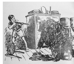
Ilustrația din carte Băieții [2]