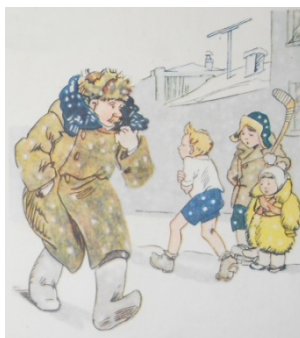
Ilustratia din carte Tomîță [1]