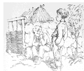
Ilustrația din carte Vacanța mea [4]