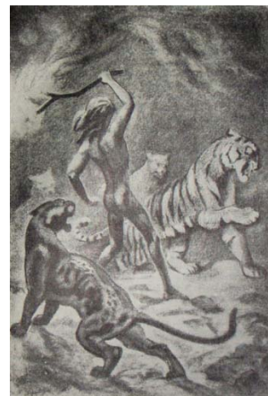
Ilustratia din carte Mowgli [6]