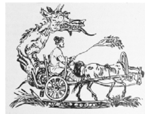
Ilustratia din carte Caftan frumos cusut pe dos [3]