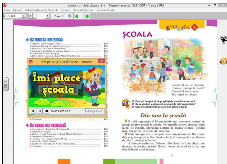
Figura 2. MD (Republica Moldova), prezentând o secvență animată la tema corespunzătoare

În primul rând, în scopul asigurării compatibilității și portabilității, MD elaborat de noi, pe diverse platforme, posibilitățile produsului nostru educațional, în mod obligatoriu, au fost ajustate perfect la diverse dispozitive digitale: tablă digitală, tabletă, smartphone, netbook, laptop, calculator personal, etc.