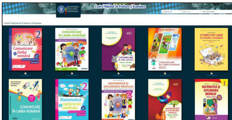
Figura 1. Versiunile MD la obiectul Comunicare în Limba română, clasa II (Romania)

▽ Manualele de Comunicare în Limba română pentru clasa a II-a sunt împărțite în două volume, fiecare dintre ele având câteva unități clar structurate, care ajută deopotrivă profesorul și elevul să parcurgă cu ușurință conținuturile programului școlar.