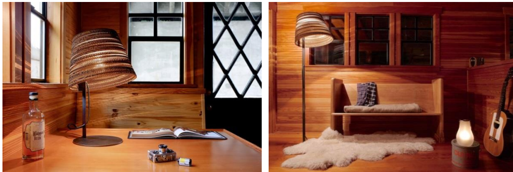
Fig.6. Încadrarea subiectului principal în cadrul compoziției fotografice.

7. Încadrarea (framing) - Lumea e plină de obiecte care fac cadre naturale perfecte cum ar fi geamurile, pereții, etc. Prin plasarea acestora în jurul cadrului compoziției, va ajuta la izolarea subiectului principal de lumea exterioară (fig.6.).