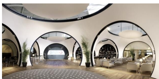
Fig.4. Linii conducătoare în cadru. Perspectiva.

Liniile conducătoare curbe sau în forma de S sunt elegante, grațioase, fermecătoare. Ele generează liniște, calm și chiar senzualitate. Perspectiva este una dintre cele mai eficiente metode de a reprezenta profunzimea și distanțele dintr-o imagine.