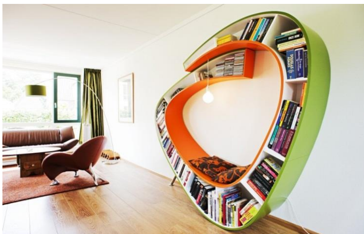
Fig.2. Regula treimilor în compoziția fotografică.

Cadrul se împarte în trei zone egale (fig.2.), atât pe verticală cât și pe orizontală. Liniile imaginare care împarte cadrul în treimi se numesc linii de forță.