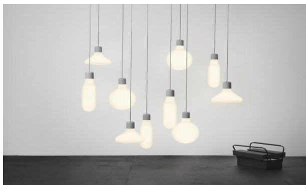
Fig. 3. Elemente de compensare în compoziția fotografică.

2. Elemente de compensare (balancing elements) - Plasarea subiectului principal în cadru, ținând cont de regula treimilor, creează o fotografie mai interesantă, dar cu toate acestea se poate lăsa un gol în scenă, care poate face ca fotografia finală să fie „goala”(fig.3.). Astfel, trebuie să echilibrăm „greutatea” subiectului principal cu un alt obiect, inclusiv, de o importanță mai redusă pentru a umple spațiul în cadru.