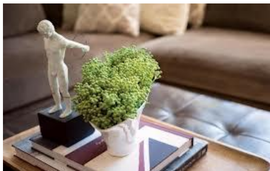
Fig.7. Decuparea subiectului principal.

8. Decuparea (cropping) - De multe ori o fotografie este lipsită de impact deoarece subiectul principal este atât de mic încât se pierde printre aglomerarea de obiecte din împrejurimile sale. Prin decupare în jurul subiectului principal se elimină "zgomotul" de fond, asigurând atenția privitorului nedivizată și concentrată asupra subiectului principal, (fig.7).