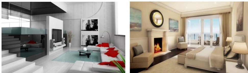
Fig.1. Imagini ale interioarelor unor apartamente.

Ținând cont de scopul final, acela de a obține reacția emoțională și rezonanța afectivă a privitorului, putem stabili ca mesajul pe care îl transmitem numai prin imagini trebuie să îndeplinească anumite condiții, care însumate duc la acceptarea lui de către privitor cu convingere în lipsa unor posibilități reale de verificare. Ca exemplu (fig.1.), care conține imagini ale interioarelor unor apartamente și decorul acestora, care dorim să fie receptată de privitor.