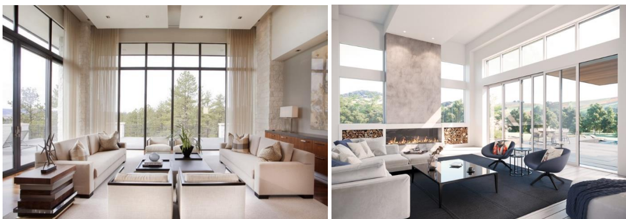
Figura 3. Spațiul de interior cu o cantitate mare de lumină naturală

Tot în strânsă legătură cu întoarcerea la natură este și evidențierea și optimizarea surselor de lumină naturală. Lumina este unul dintre punctele cheie în amenajările interioare deoarece ea oferă un aspect armonios și plăcut spațiului (fig.3) [1]. Dincolo de aspectul estetic, utilizarea luminii naturale contribuie la conservarea energiei electrice și are un rol benefic în susținerea stării de bine a omului, de aceea este necesar de proiectat astfel spațiul încât cantitatea acestuia să fie optimă.