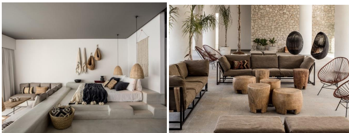
Figura 1. Exemplu de interior în stilul eco

Obiectivele eco-designului sunt concepute printr-un proces continuu de reevaluare a practicilor de proiectare și producere, orientate spre asigurarea societății contemporane cu produse ecologice, crearea unor condiții ecologic favorabile de viață prin amenajarea adecvată a interiorului, prin protejarea mediului natural (fig.1) [6].