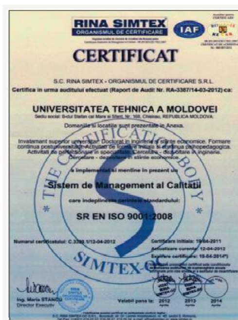
Fig. 2. Certificat de conformitate a SMC la UTM

Etapa de implimentarea a Sistemului de Management al Calitații la Universitatea Tehnică a Moldovei a fost finalizată prin obținerea Certificatului de conformitate (fig.2).