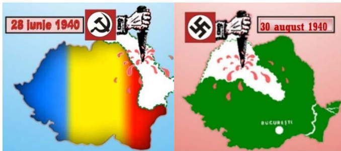
Fig. 1. Raptul Basarabiei și nordului Transilvaniei.

Se apropia anul de cumpănă 1940. În Eurasia apar doi căpcăuni – Stalin și Hitler, care doreau să reîmpartă lumea. Prin Pactul secret încheiat între cei doi la 23 august 1939 Basarabia este din nou vizată. La 28 iunie 1940 Basarabia este ocupată de cei cu secera și ciocanul. „ Vin bolșevicii, cu noi rânduri,/ La Prut, de sârmă ghimpată,/ Vine satana, ascunsă-n odăjdii divine./ Vine minciuna. Vine teroarea. Negura vine ”, scria cu durere în suflet despre acele zile negre reputatul poet și patriot al Neamului Gr. Vieru. Doar peste o lună – la 30 august același an –