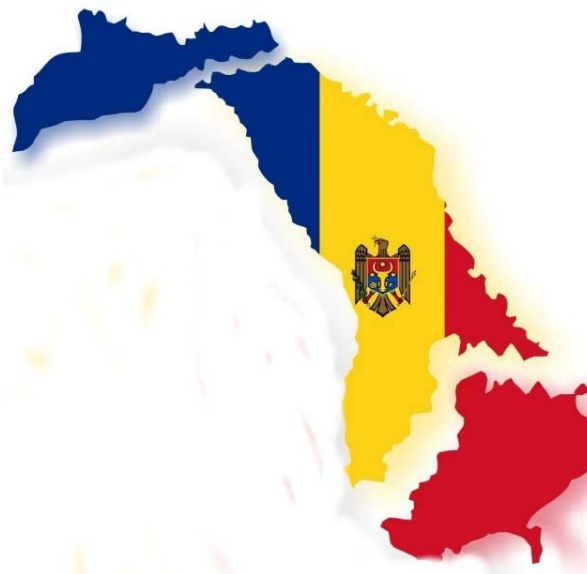
Fig. 4. Harta Basarabiei și Bucovinei de nord sfărțecată în trei părți.

Mai mulți istorici își pun întrebarea de ce Stalin a acceptat această împărțire arbitrară a Basarabiei și fostei RASSM? Una din concluzii ar fi că primul secretar de atunci al RSSU, N. S. Hrushhyov, i-a prezentat lui I.V. Stalin o informație falsă privind componența etnică a așa numitei regiuni Dunărene, majoritatea fiind ucraineni. Este greu de crezut că Stalin ar fi putut fi mințit de Hrushhyov. Stalin cunoștea foarte bine problemele naționale, de care se ocupa de multa vreme (în anturajul lui Lenin acesta era domeniul de care răspundea Stalin). Trasarea hotarelor între republicile unionale (Armenia și Azerbaijan, Georgia și Rusia, Republica Moldova și Ucraina ș.a.) mai degrabă a fost un plan bine calculat cu bătaie lungă al lui Stalin. Includerea întregii RASSM în componența noii RSSM ar fi modificat componența etnică a Republicii deoarece în raioanele rămase în afara