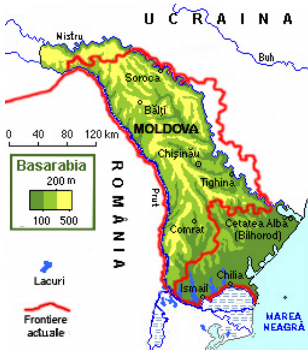
Fig. 2. Harta RSSM. S. Manoliu – Cartoteca. https://ro.wikipedia.org/w/index.php?curid=416915

Astfel varianta finală a RSS Moldovenești cu capul și picioarele retezate, fără acces în Carpați și la Mare, aprobată de ștabii partiinici de la Moscova și Kiev, a fost transmisă pentru a fi examinată la sesiunea a VII-a a Sovietului Suprem al URSS din 2 august 1940 (la doar puțin peste o lună de la ocuparea Basarabiei!). „... Basarabia și RASSM a trimis la cea de a 7-a sesiune a Sovietului Suprem al URSS o delegație unică, formată din cei mai buni fii și fiuce ” (când au reușit la doar o lună de la momentul ocupării Basarabiei să-i găsească pe cei mai buni) scriu într-un mod triumfalist falșii istorici sovietici.